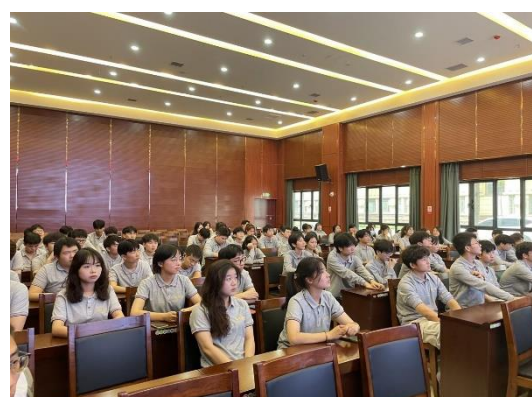
图 1、图 2 “企业工匠进校园”学术讲座