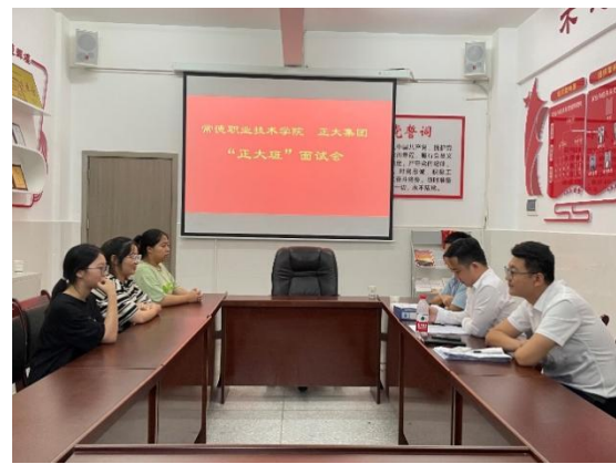
图 8 “正大班”面试会