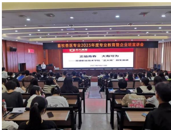
图 7 正大集团宣讲

2023 年 9 月 14 日，校企双方在学院图书馆 1 号报告厅举行了畜牧兽医专业 2023 级新生专业教育暨企业班招新宣讲会，正大畜牧（石门）有限公司人事经理徐泽培分别从工作环境、培养模式、薪酬待遇、发展空间等方面进行了介绍和展示，与同学们热情互动，回答同学关心的问题，还鼓励同学们要好好把握在校学习的大好时光，学习好基本理论知识，掌握基本实践技能，为以后进入企业学习和工作奠定坚实基础。