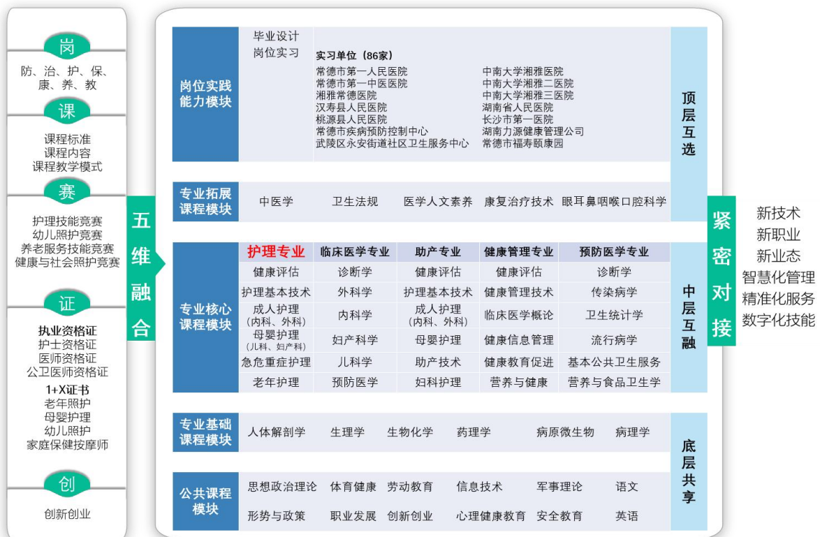
图1 护理专业群课程模块体系